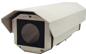
Carcasa para exteriores