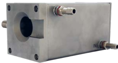
Chaqueta de enfriamiento con collarín de purga de aire

El Procesador de Imágenes Térmicas ThermoView TV30 provee capacidades de control de procesos y monitoreo para aplicaciones industriales. La pequeña huella del Procesador de Imágenes Térmicas fijo permite una instalación más sencilla, mientras que las